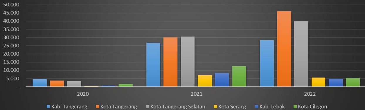
Tren Kesembuhan Pasien Covid-19