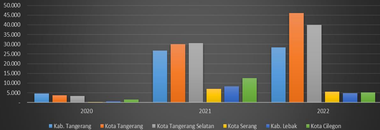
Tren Kesembuhan Pasien Covid-19